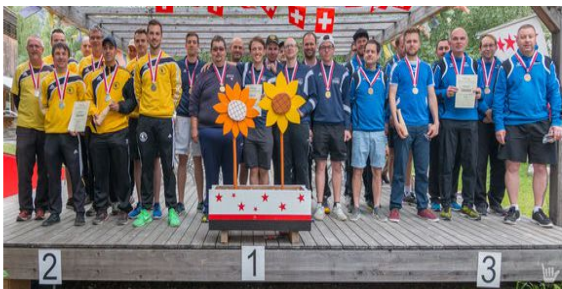
v.l.: Burgdorf (2), Eichholz (1.), Olten (3.)