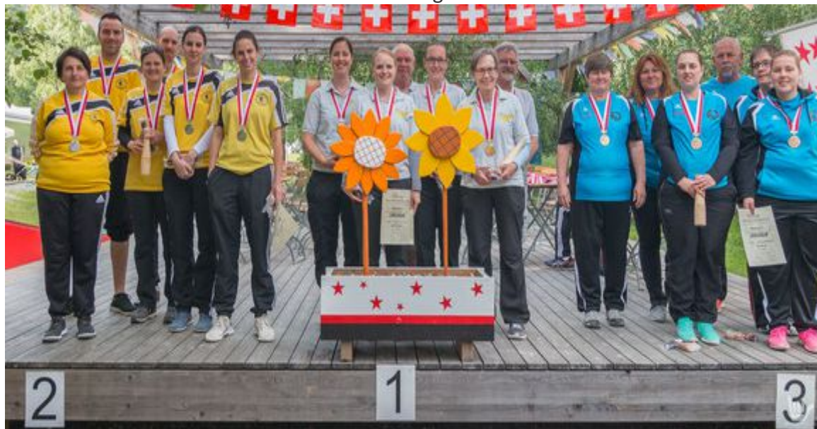
v.l.: Burgdorf (2.), Effretikon (1.), Rhone (3.)

Effretikon Damen und Eichholz Herren verteidigen ihren Titel !